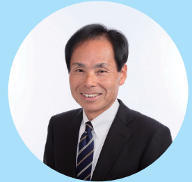
原沢伊都夫 静岡大学名誉教授